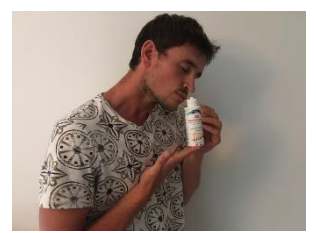
Lavez-vous les mains régulièrement, Utilisez du gel Hydroalcoolique

(en cas d'oubli, nous vous en fournirons pour la modique somme de 1 €)