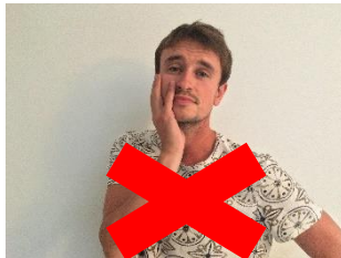
Evitez de vous toucher le visage