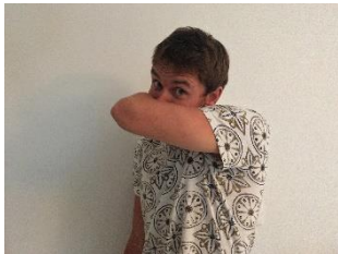
Toussez/éternuer dans votre coude