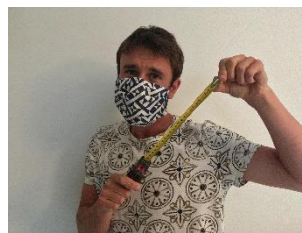
Gardez 1 mètre de distance, sinon masque obligatoire

(en cas d'oubli, nous vous en fournirons pour la modique somme de 1 €)